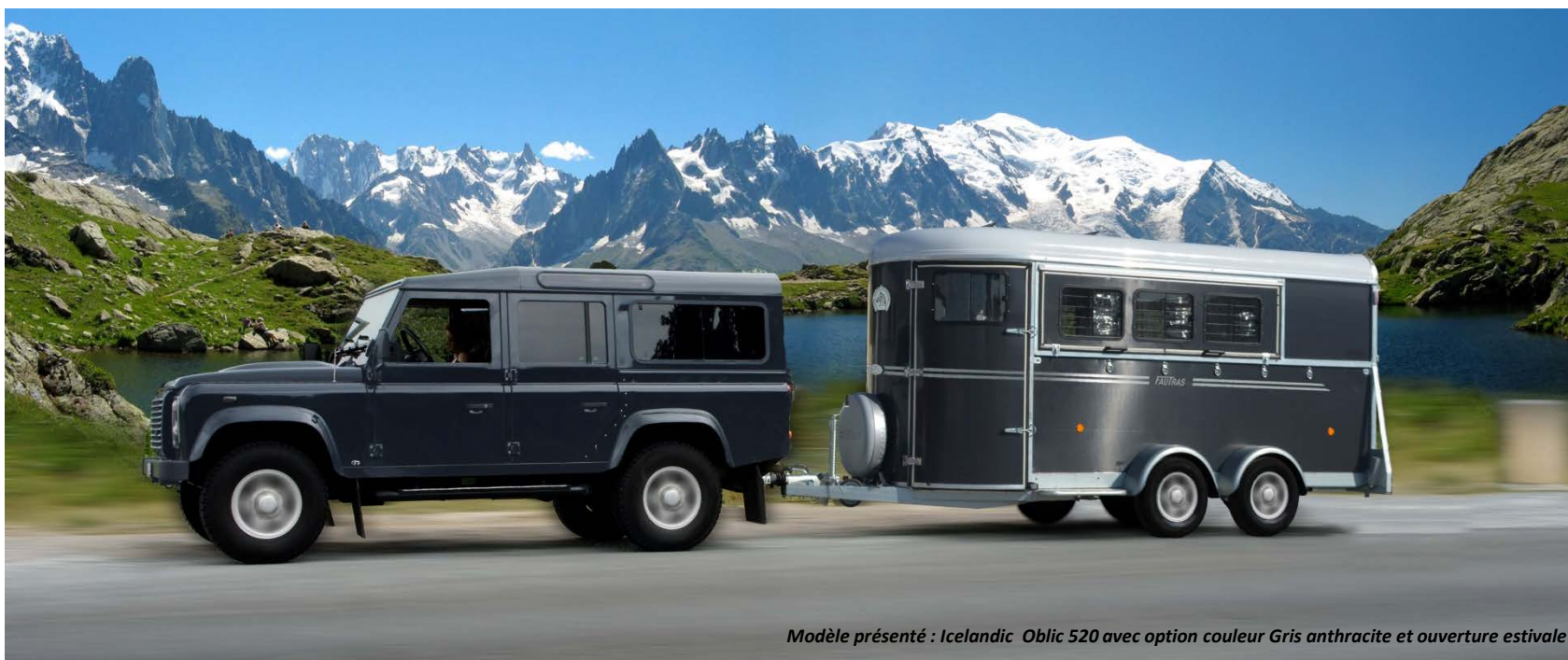
Modèle présenté : Icelandic Oblic 520 avec option couleur Gris anthracite et ouverture estivale

Carrosserie polyester mono-coque aérodynamique.