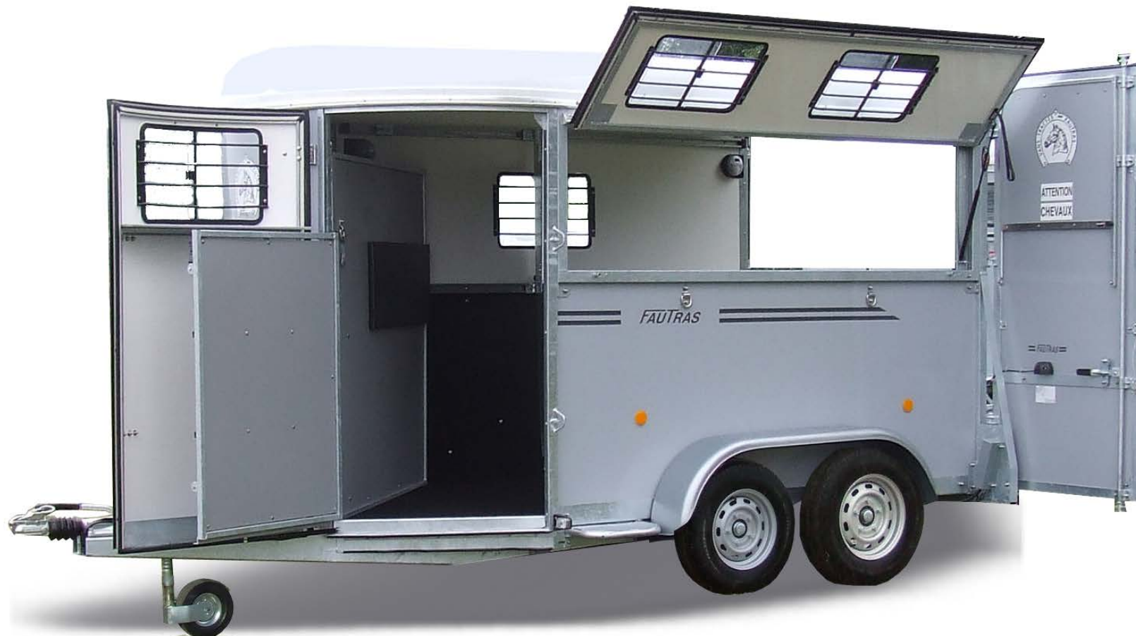
Modèle présenté : Icelandic Oblic 350 avec option couleur Gris perle et ouverture estivale

souple en 2 parties démontables, réglables, coulissantes et autobloquantes (en option).